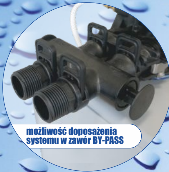
możliwość doposażenia systemu w zawór BY-PASS

Wysokiej jakości kompaktowe zmiękczacze wody serii „HYDRO OCEAN” z nowoczesnym zaworem sterującym „HYDRO PREMIUM”