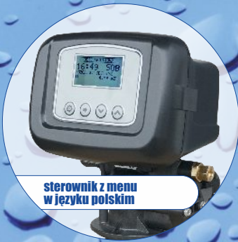
sterownik z menu w języku polskim