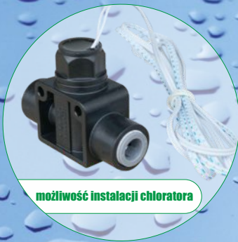
możliwość instalacji chloratora