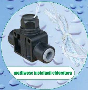
możliwość instalacji chloratora