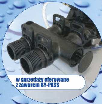
w sprzedaży oferowane z zaworem BY-PASS

Wysokiej jakości kompaktowe zmiękczacze wody serii „HYDRO CRYSTAL” z nowoczesnym zaworem sterującym „HYDRO PREMIUM”.